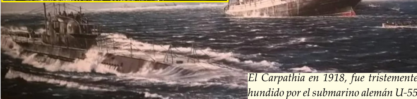
El Carpathia en 1918, fue tristemente hundido por el submarino alemán U-55